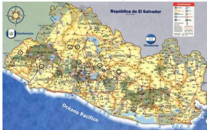
Mapa 1. Localidades visitadas para el trabajo de campo. El Salvador, 2007

Las técnicas cualitativas corresponden a entrevistas narrativas y grupos focales, para su aplicación fueron seleccionadas adolescentes de cada uno de los proyectos de los municipios de intervención a quienes se les indagó sobre los beneficios recibidos y sus percepciones frente al programa.